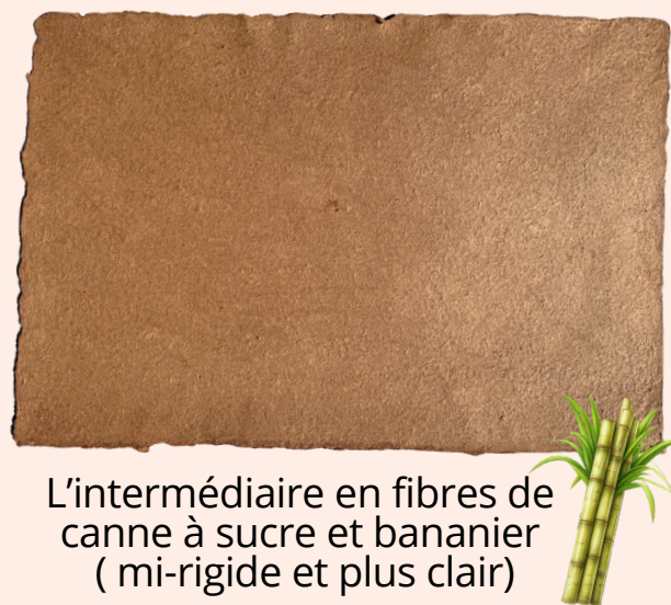
L'intermédiaire en fibres de canne à sucre et bananier (mi-rigide et plus clair)