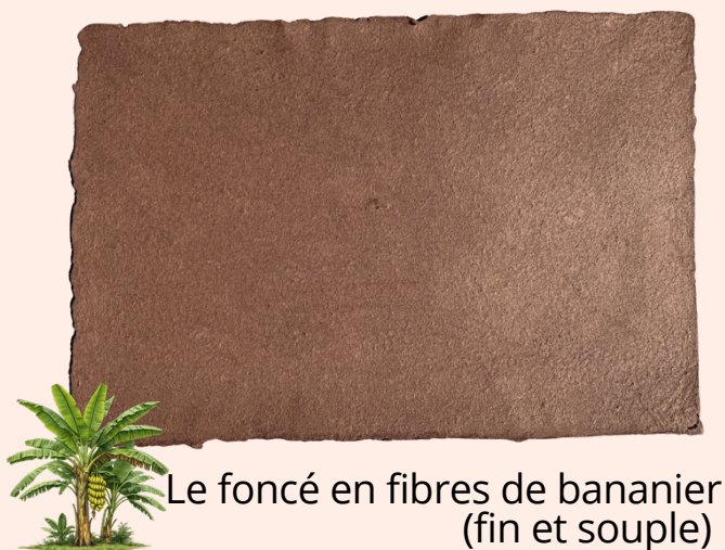
Le foncé en fibres de bananier (fin et souple)

Prenez soin de lui, et ensemble, préservons notre Fenua.