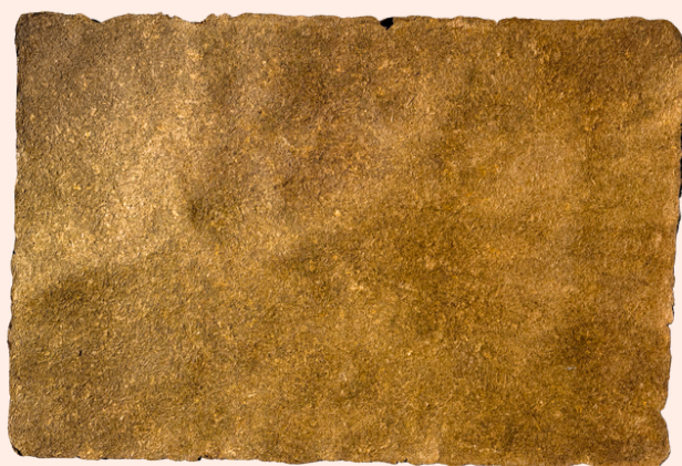
Le vert en fibres d'ananas (fin et souple)